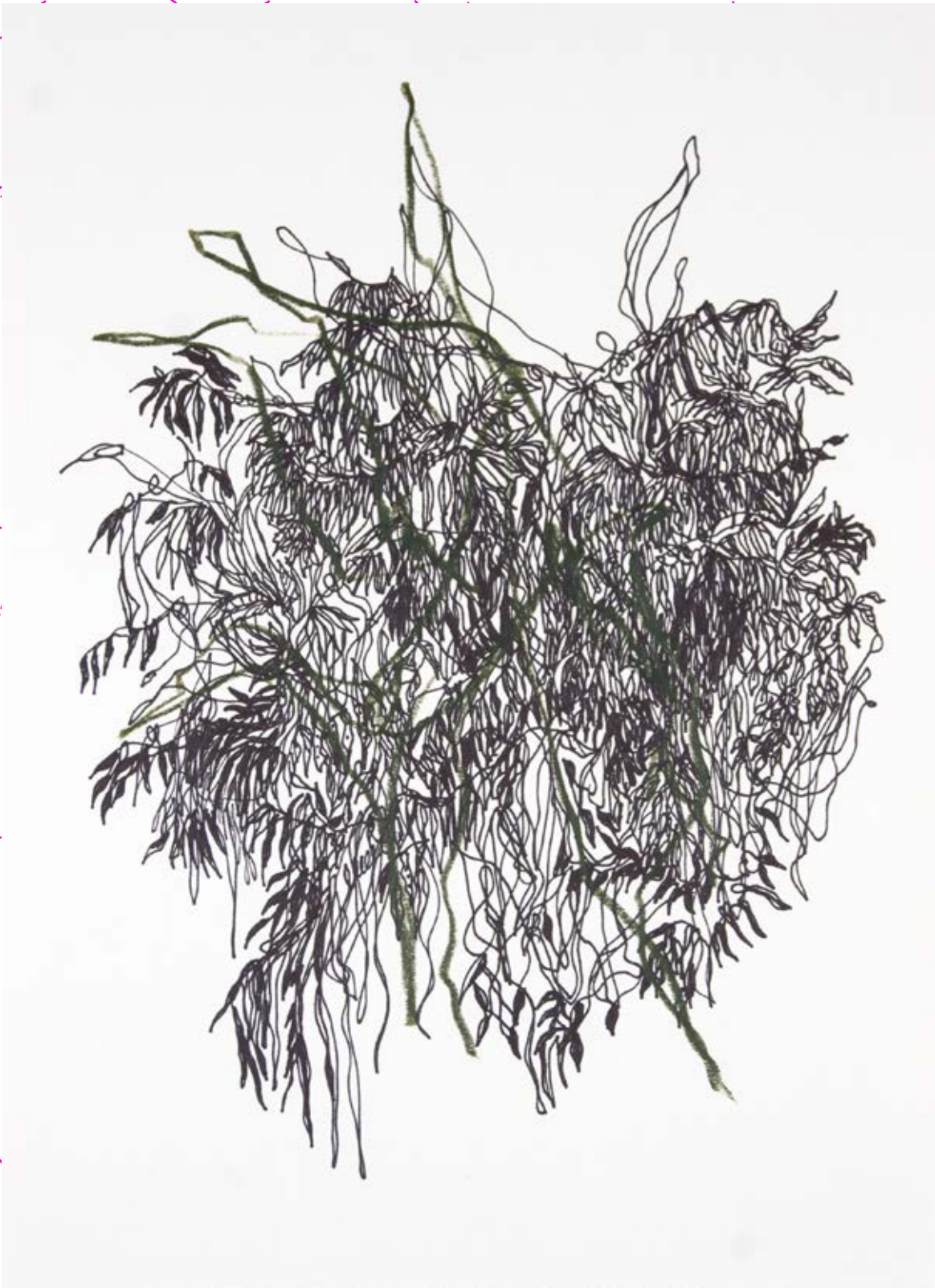
Hierbaviva, 2020 Plumón y lápiz de cera sobre papel 23 x 30 cm $4,500.00 m.n.