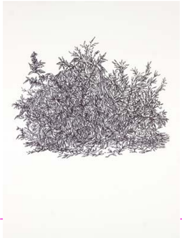
Hierbaviva, 2020 Plumón y lápiz de cera sobre papel 23 x 30 cm $4,500.00 m.n. cada una