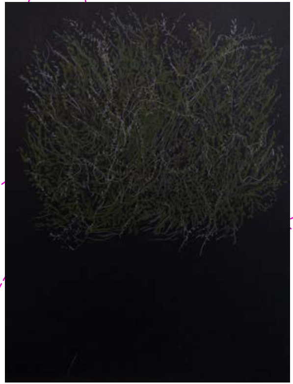
Nocturno #2, #3, #4 y #5, 2021 Lápiz de color sobre papel 23 x 30 cm $5,000.00 m.n. cada una