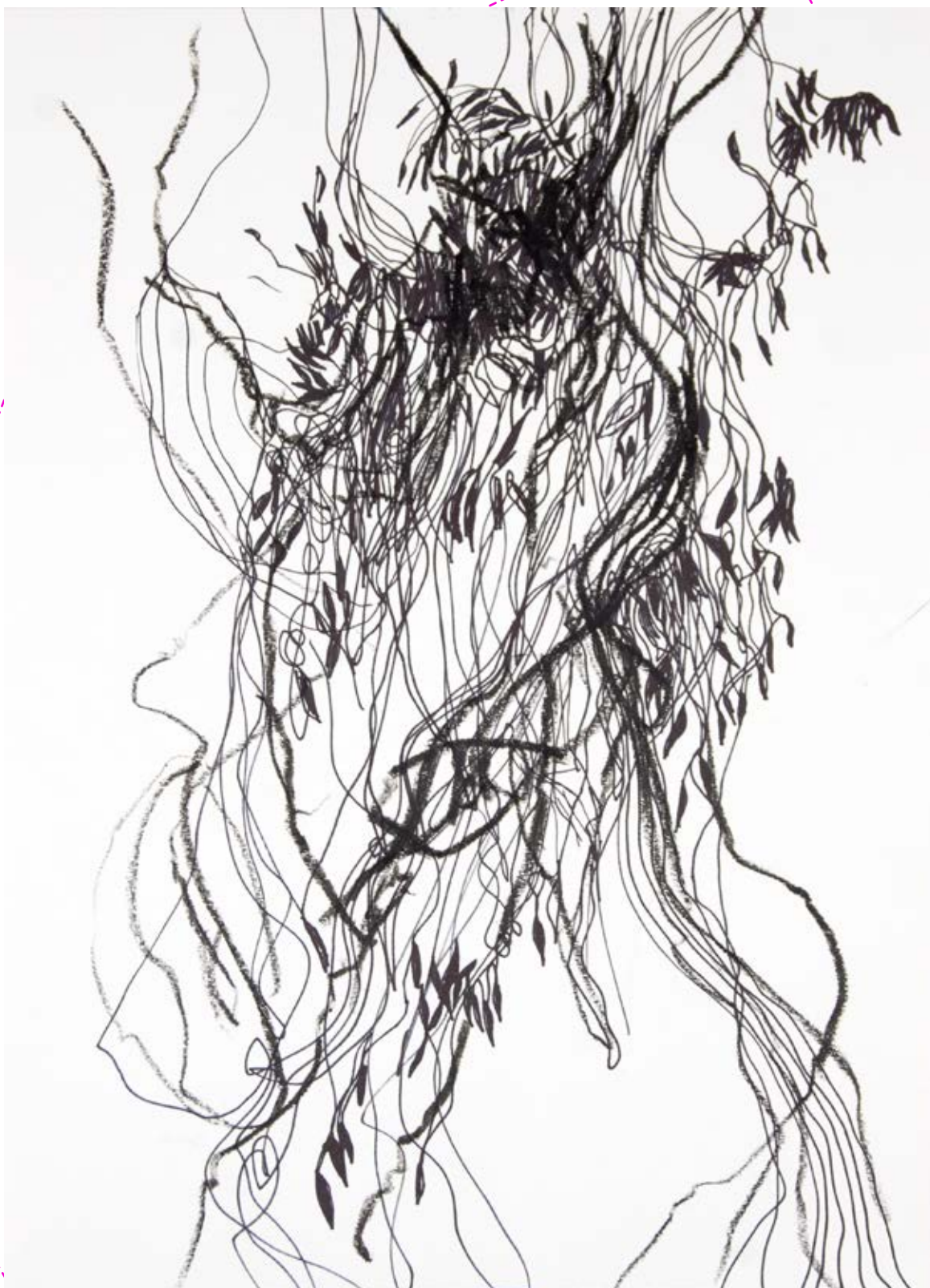
Parto , 2021 Óleo sobre papel imprenta 23 x 30 cm $4,500.00 m.n.