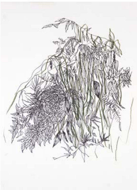
Hierbaviva , 2020 Plumón y lápiz de cera sobre papel 23 x 30 cm $4,500.00 m.n cada una