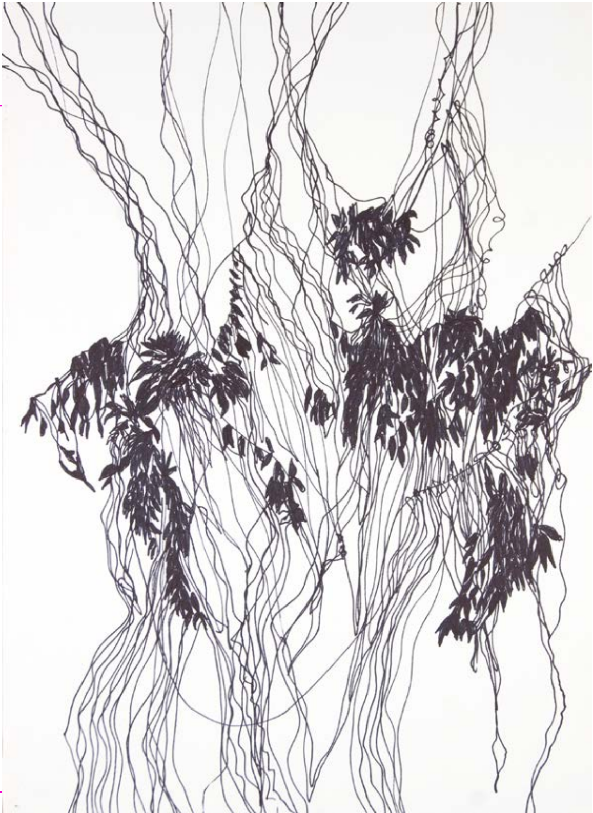
Hierbaviva, 2020 Plumón y lápiz de cera sobre papel 23 x 30 cm $4,500.00 m.n.