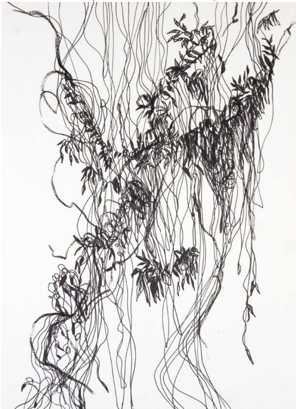
Hierbaviva, 2020 Plumón y lápiz de cera sobre papel 23 x 30 cm $4,500.00 m.n.