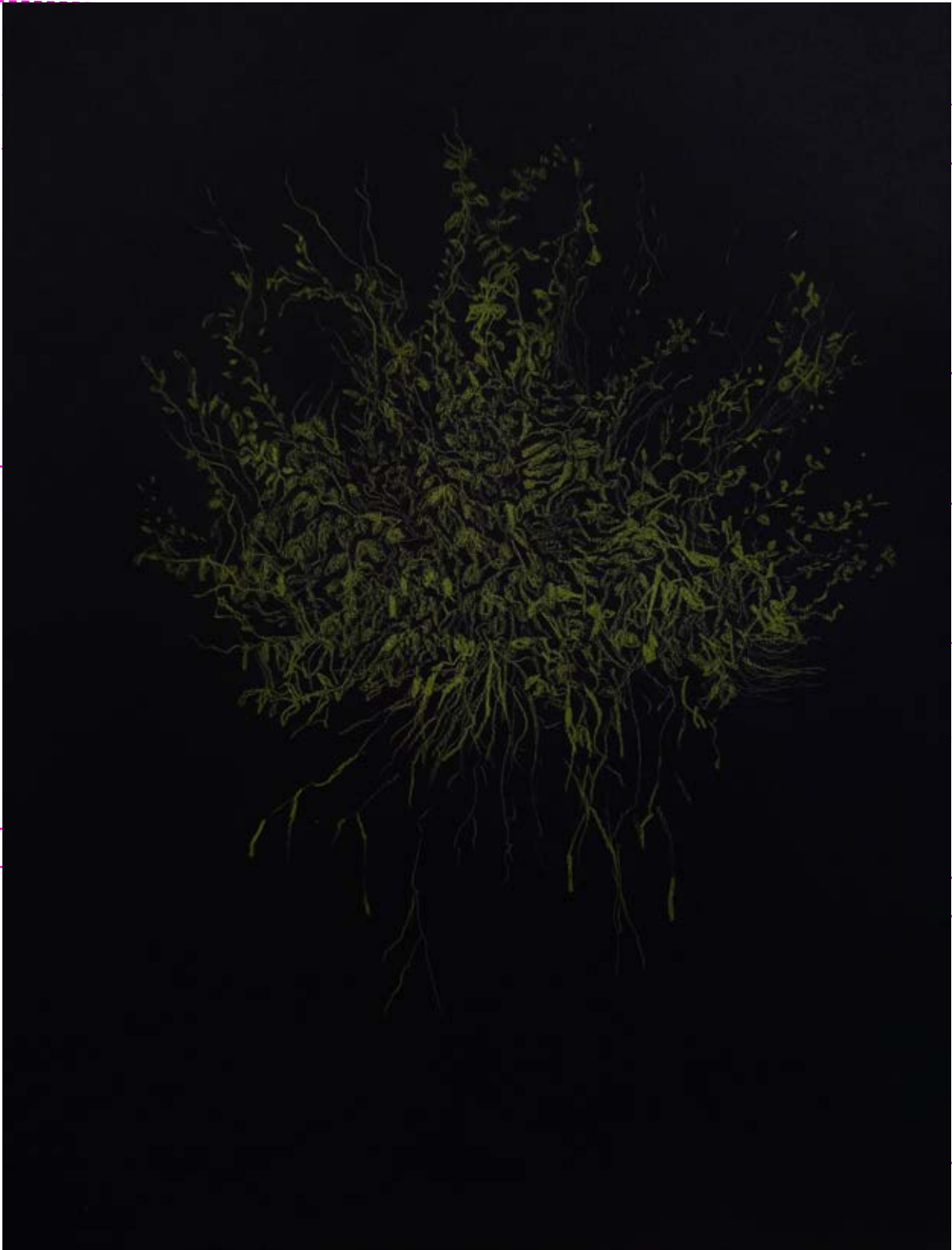
Nocturno #1, 2021 Lápiz de color sobre papel 23 x 30 cm $5,000.00 m.n.